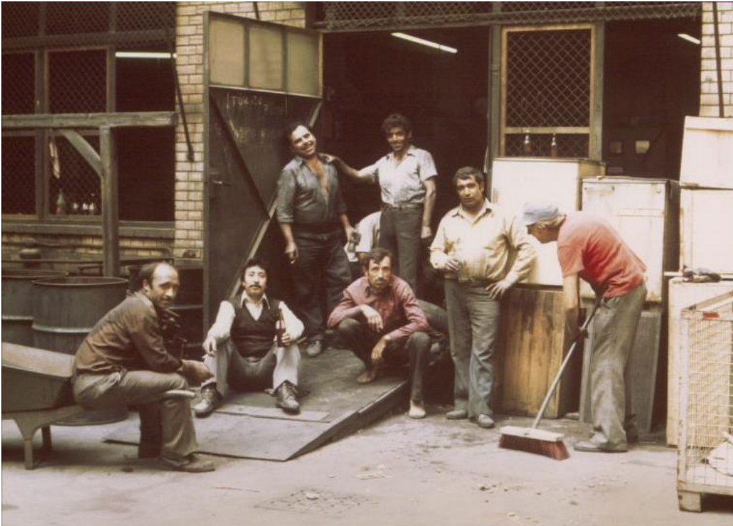
Manfred Hamm, o.T., Türkische Gastarbeiter in einem Kreuzberger Betrieb, Berlin, 1977 © Stadtmuseum Berlin