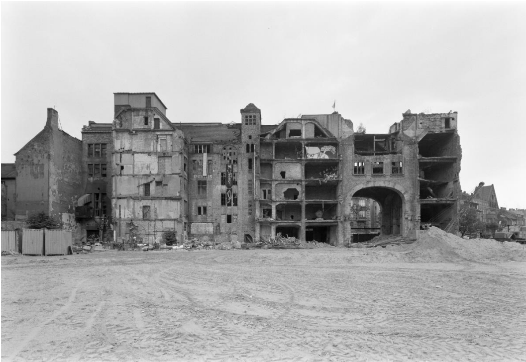
Manfred Hamm, o.T., Künstlerhaus Tacheles in der Oranienburger Str. 60 Berlin, o.J. © Stadtmuseum Berlin