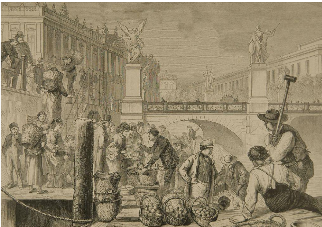
Der Obstmarkt in Berlin um 1865, Holzstich

Das politische Selbstbewusstsein wuchs mit dem Aufschwung der Stadt. Die Mehrheit aber blieb weiterhin von Mitbestimmung ausgeschlossen. In diesem Widerspruch lag der Ausgangspunkt revolutionärer Ereignisse. Arbeiter:innen, Handwerker und Gesellen litten unter geringen Einkommen. Sie begehrten gegen die Obrigkeit auf und sperrten Straßen mit Barrikaden. Zehntausende Unterstützer:innen aus anderen Gruppen schlossen sich an. Gemeinsam kämpften sie für Freiheitsrechte und politische Teilhabe. Die Revolution fand nicht nur in Preußen und den deutschen Ländern statt. Andere städtische Zentren der Revolution in Europa waren Paris und Wien. Berlin wurde zu einem politischen und gesellschaftlichen Brennpunkt.