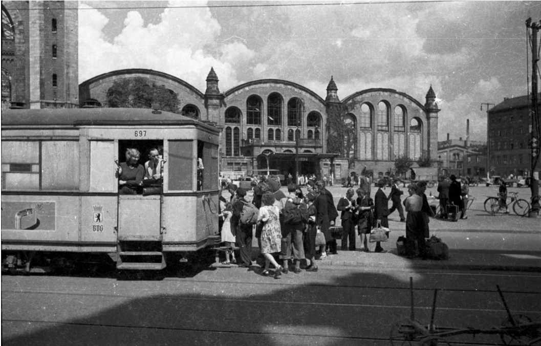
Cecil F. S. Newman, Straßenbahnhaltestelle der Linie 44 in der Invalidenstraße am Stettiner Bahnhof; Mitte, sowjetischer Sektor, Berlin, 1945/46

Das nationalsozialistische Deutschland rüstete militärisch wieder auf. Als Industriestandort profitierte Berlin von der steigenden Nachfrage. In den Fabriken entstanden Panzer, Geschütze und Flugzeugmotoren. Die Wehrmacht baute Kasernen und erweiterte Flugplätze. Hitler betrachtete Krieg als wichtigstes Mittel seiner Außenpolitik. Osteuropa sollte unterworfen und Teil eines deutschen Großreichs werden. Bei einem Treffen mit hohen Militärs 1937 betonte Hitler das Ziel eines möglichst zeitnahen Angriffs auf die Sowjetunion (UdSSR). Berlin war als Kommandozentrale, Stützpunkt und Rüstungsschmiede maßgeblich in diese Kriegsvorbereitungen eingebunden.