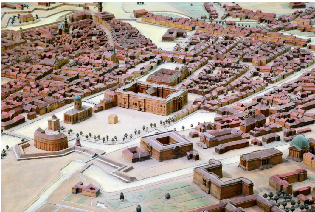
Walter Winkler (Entwurf), Prenzel, E. und Göhring (Hersteller): Modell der Haupt- und Residenzstadt Berlin um 1750

Friedrich I. sah in Berlin eine Bühne für seinen Herrschaftsanspruch. Pracht und Prunk ließen die Stadt erstrahlen und mit ihr den König. Den Mittelpunkt bildete das umgebaute und erweiterte Schloss. Auf dieses Gebäude lief die neu gestaltete Allee „Unter den Linden“ zu. An der Straße entstanden beeindruckende Bauwerke wie das Zeughaus. Akademien für Wissenschaft und Kunst wurden gegründet. Niemand konnte die teure Stadtpolitik von Friedrich I. beeinflussen. Sein Regierungsstil war die treibende Kraft für die Berliner Wirtschaft. Der Hof sorgte für die Nachfrage nach hochwertigen Waren und Gütern. Rund um das Königshaus entstanden ganze Berufszweige.